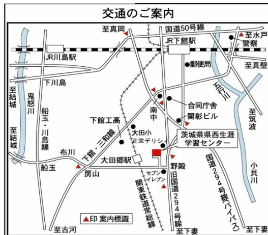
関東鉄道常総線大田郷駅徒歩8分 (案内板あり)

問い合わせ先 指定管理者（運営）財団法人茨城県教育財団 茨城県県西生涯学習センター 筑西市野殿 1371 番地(〒308-0843) 電話 0296-24-1389 (相談コーナー)・1151(事務室) FAX 0296-24-1450 http://www.kensei.gakusyu.ibk.ed.jp e-mail: info@kensei.gakusyu.ibk.ed.jp