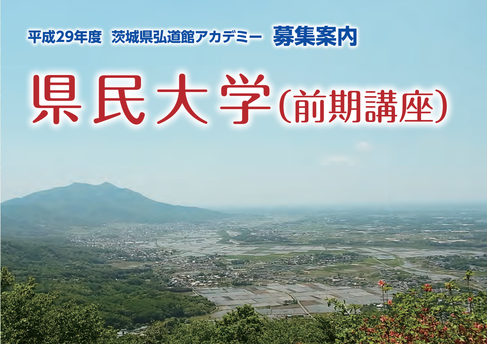
雨引山より筑波山・関東平野をのぞむ(桜川市)