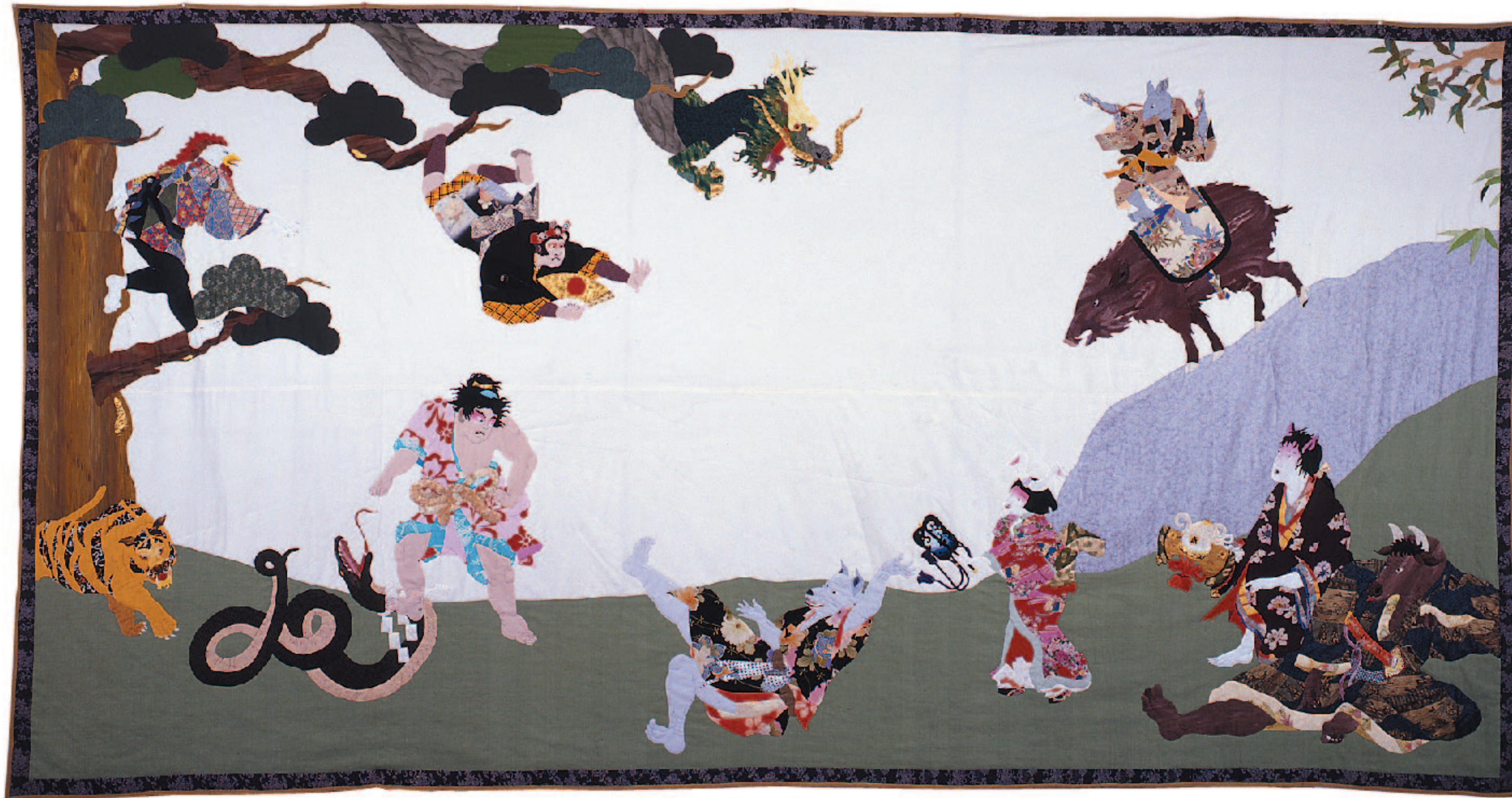
金太郎と十二支 (1993年) 282×540cm おとぎ話シリーズより