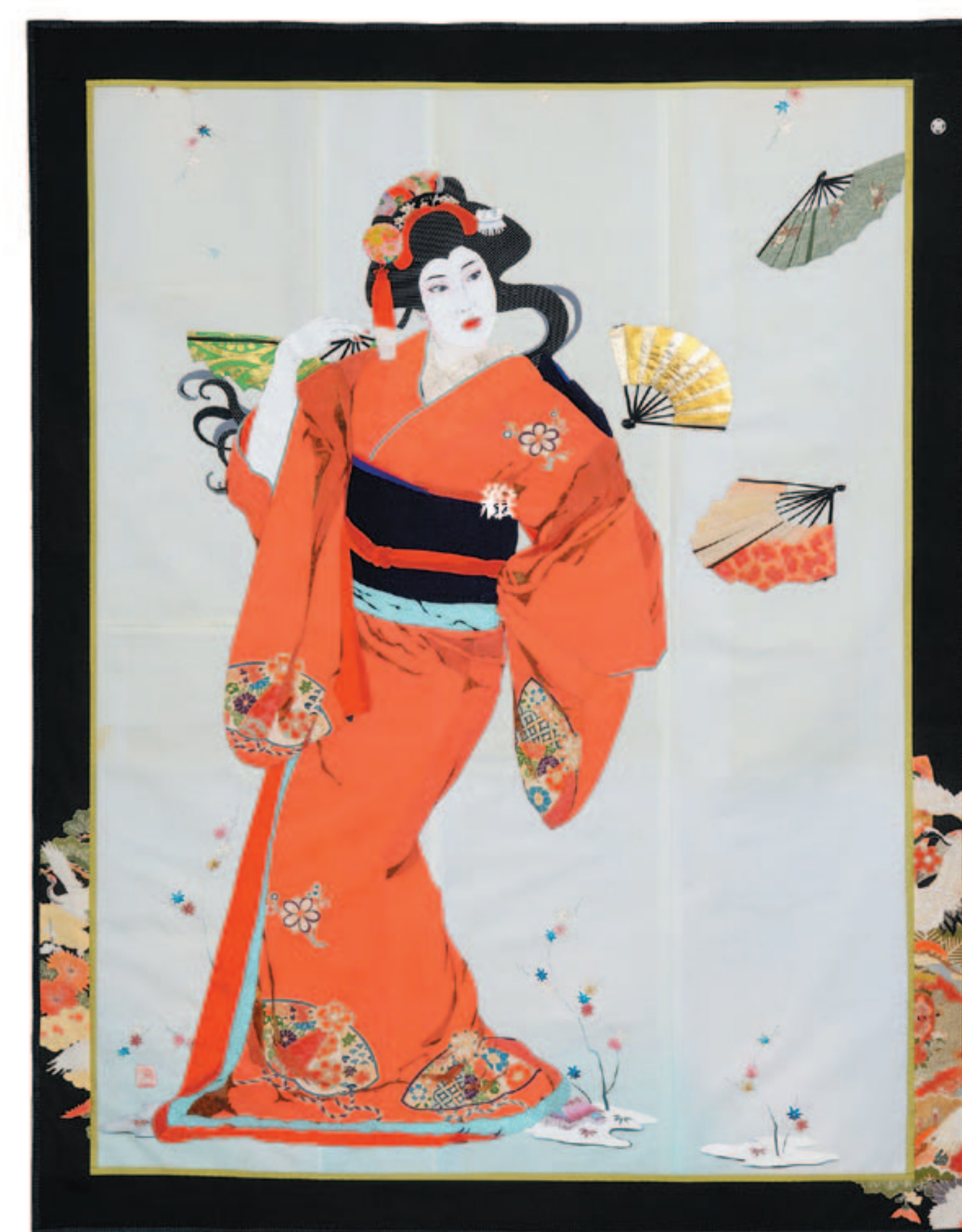
扇の風によって (2008年) 170×132cm 日本舞踊シリーズより