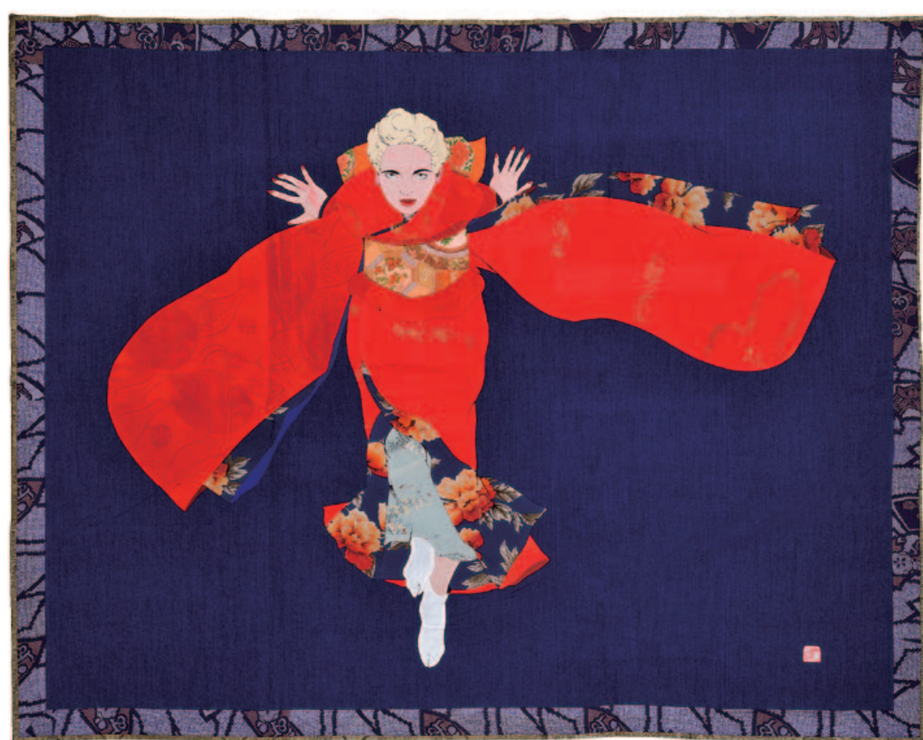
じっと見る (1995年) 165×205cm 藍色台紙シリーズより