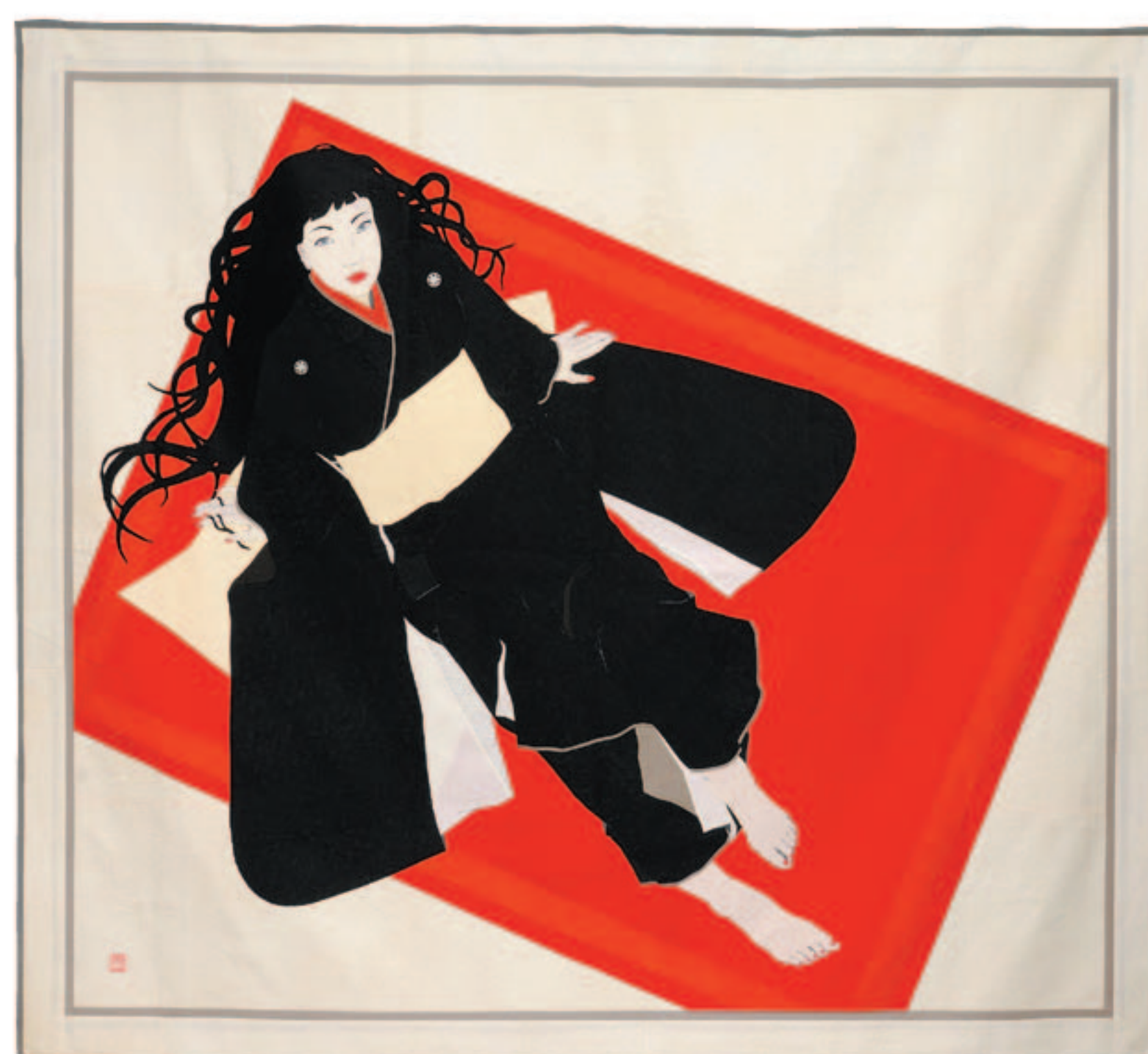
赤い絨毯 (2003年) 170×190cm 無彩色シリーズより