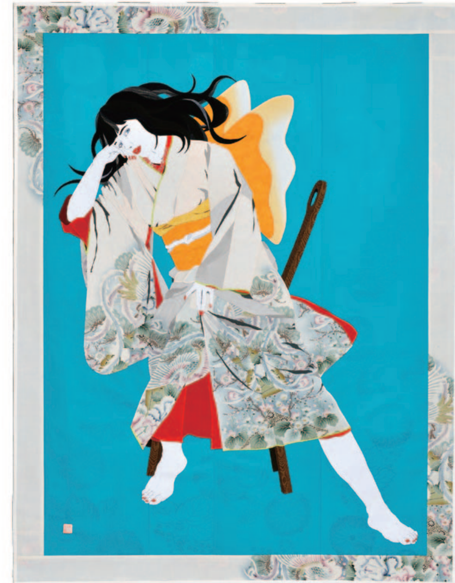
白の想ひ (2014年) 178×136cm メッセージシリーズより