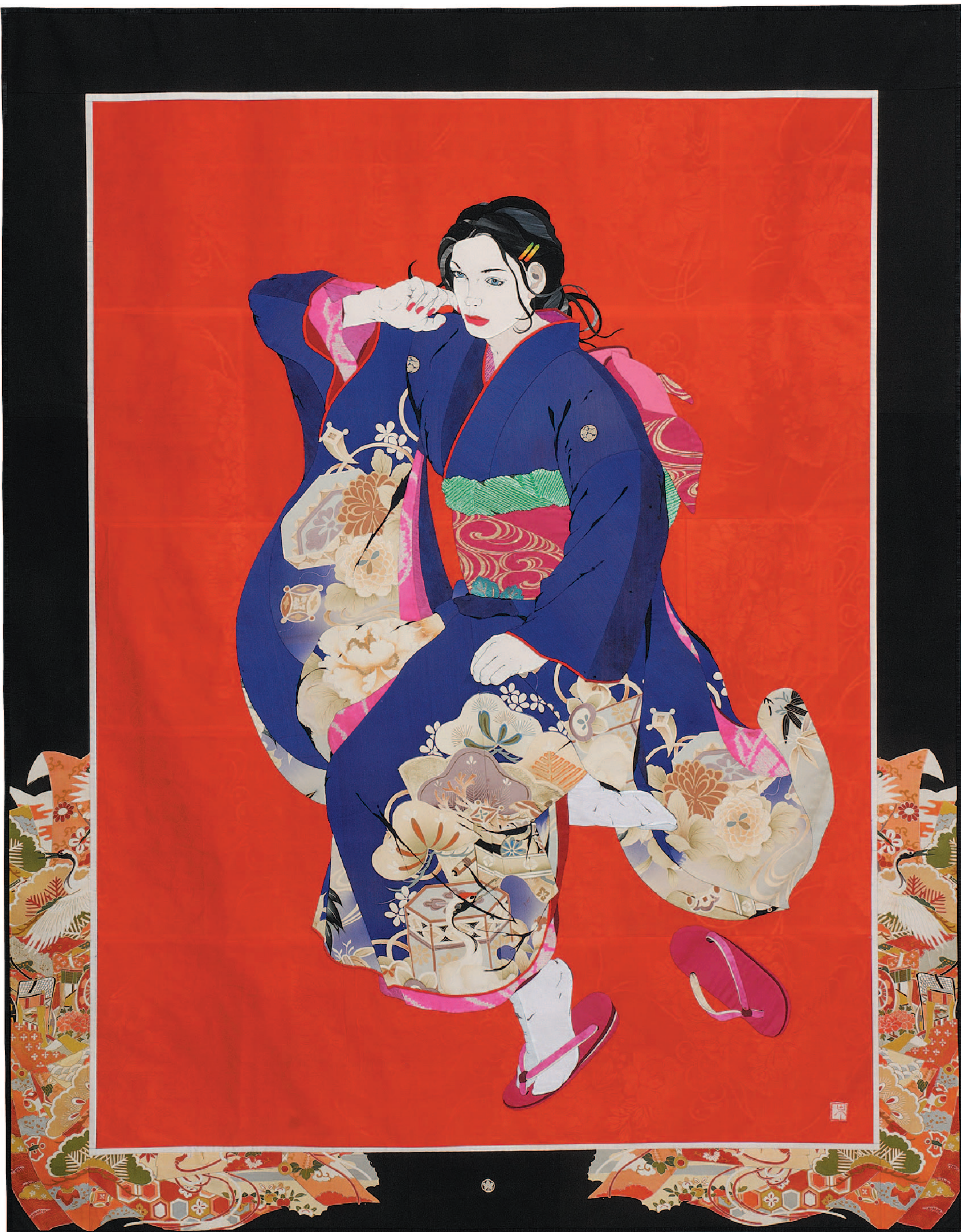
明日からの空想 (2006年) 190×150cm メッセージシリーズより

日本の古布で描く布絵（NUNO'E）。懐かしくて新しい。貴方もきつと感動します。